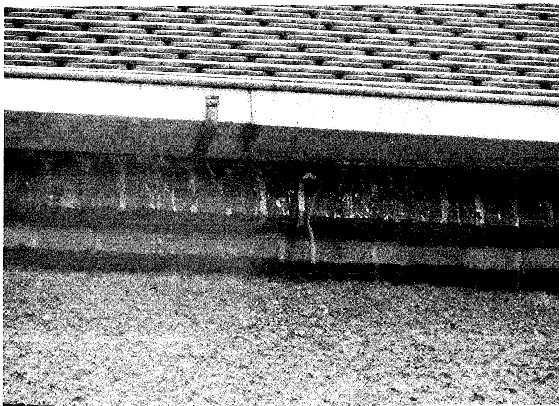
Fot.5. Siedlisko w zbliżeniu.