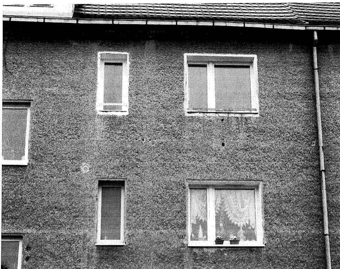
Fot.2. Siedliska w zbliżeniu (aut. Szymon Wójcik).