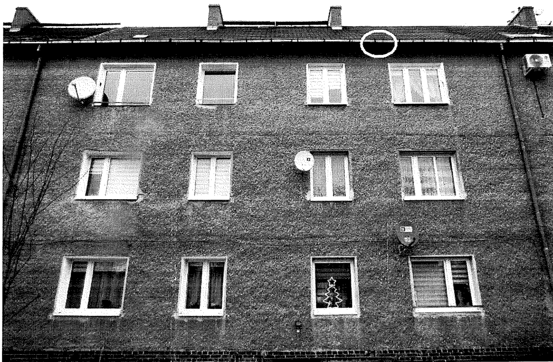
Fot.4. Ściana południowa; oznaczono siedlisko wróbla i jerzyka.