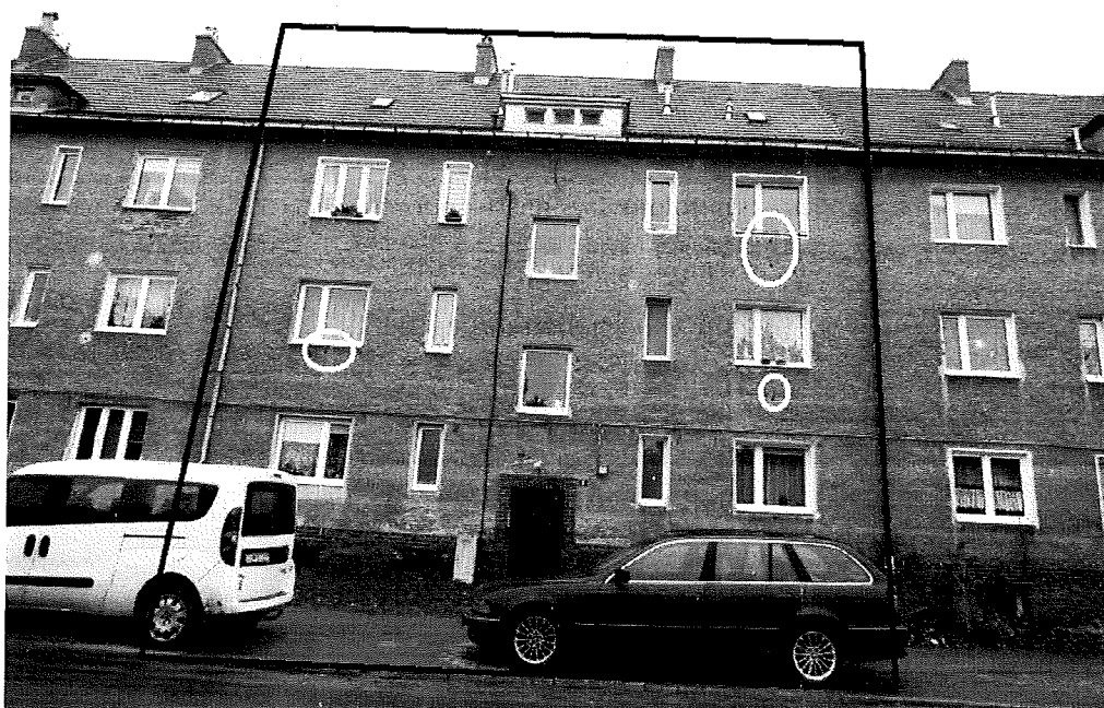
Fot.1. Ściana północna, wielokątem oznaczono granice segmentu, a okręgami potencjalne siedliska ptaków.