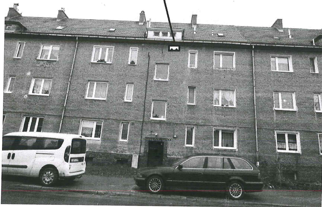
Fot.6. Zalecane miejsce montażu 2 budek dla jerzyka na ścianie północnej (aut. Szymon Wójcik).

Simprint Sp. z o.o. Al. Tadeusza Kościuszki 80/82 lok. 301 90-437 Łódź NIP: 725 224 16 52 simprint@onet.pl Kom. 609 888 003