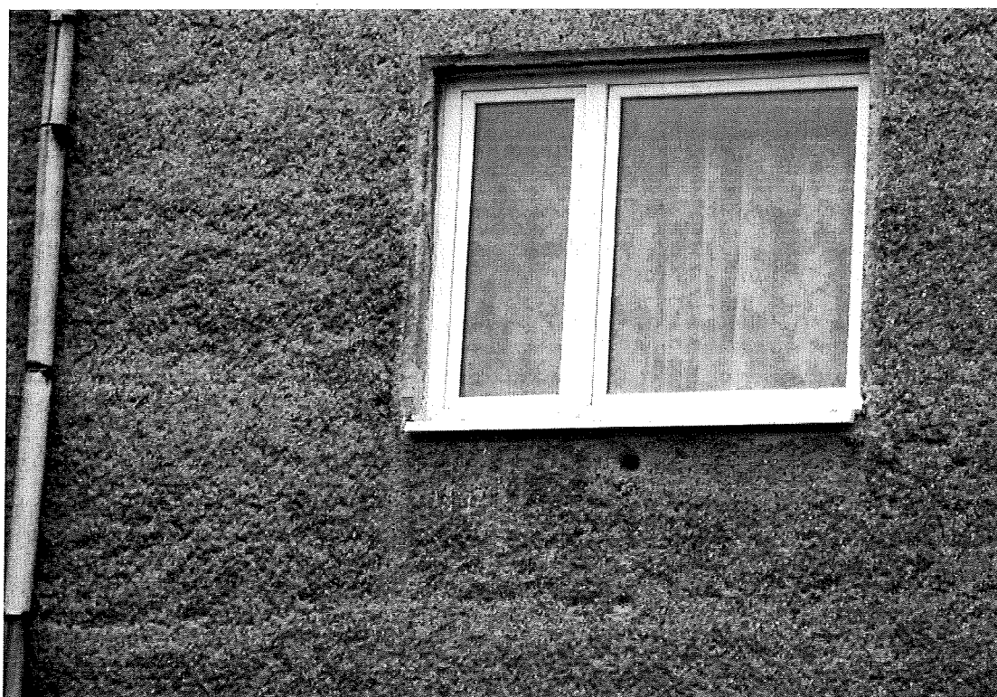
Fot.3. Siedlisko w zbliżeniu.